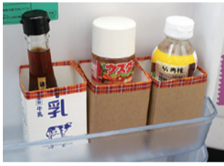
切り口はマスキングテープで保護。紙でぐるっと巻けばかわいい仕上がり

ドアポケットのタレ、ドレッシングなどは液垂れしやすいのが悩み。汚れも落ちにくく、菌の繁殖の元に。牛乳パックをきれいに洗って乾かし、長さをカットしたものに入れてみて。汚れたら交換すればいつでも清潔。